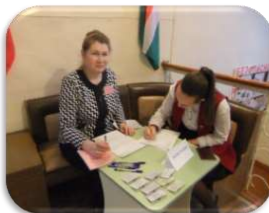
Регистрация участников XVI олимпиады по психологии.