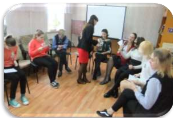
Рабочие моменты Олимпиады.