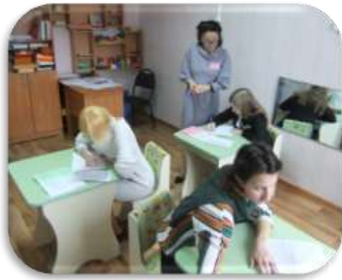
«Психологический анализ текста»