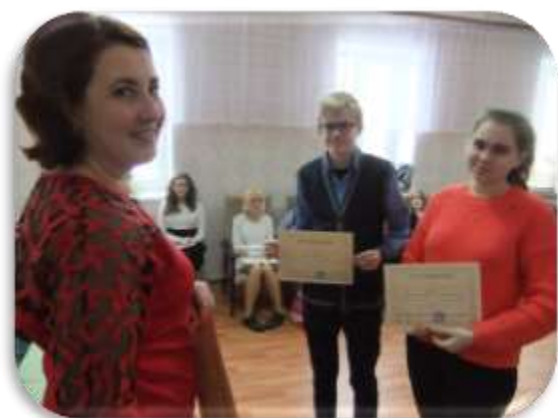
Награждение участников Олимпиады.