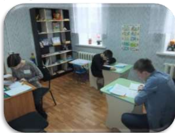
Этап Психологический анализ текста 2016г.