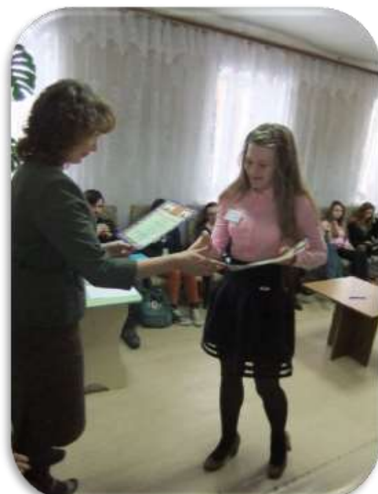
Награждение победителей и участников олимпиады 2016г.