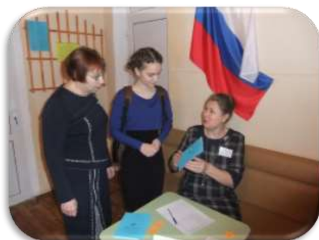
Регистрация участников олимпиады 2016г.