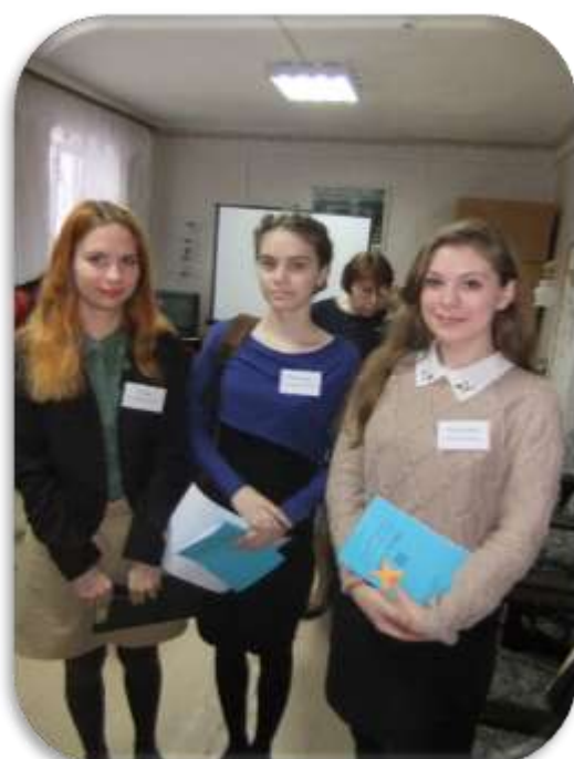
Экипажи отправляется по этапам олимпиады 2016г.