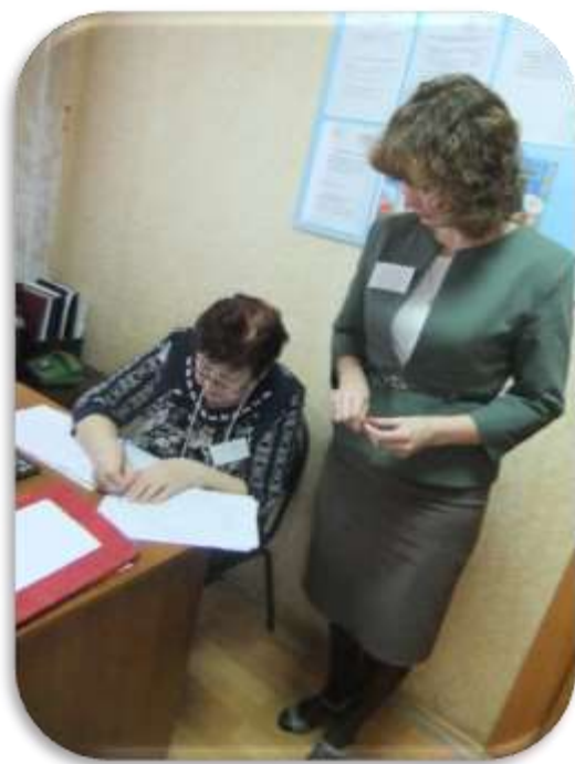
Подведение итогов олимпиады 2016 г.