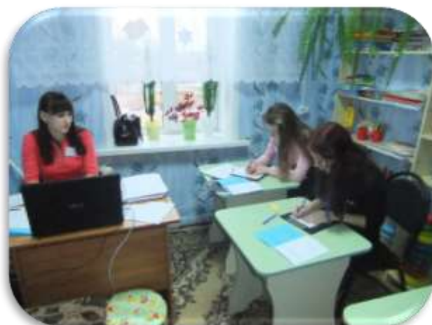
Этап Невербальная коммуникация 2016 г.