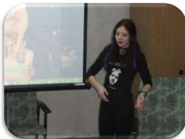
Этап Самопрезентация 2016 г.