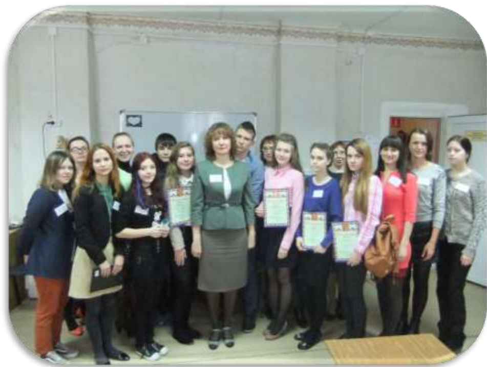
Коллективное фото на память 16.02.2016г.